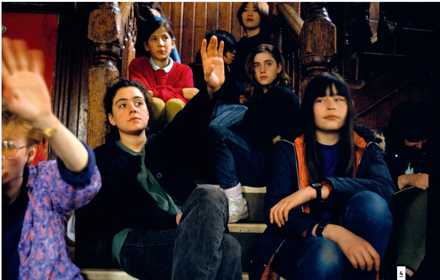
Demokratie in Summerhill (1993)