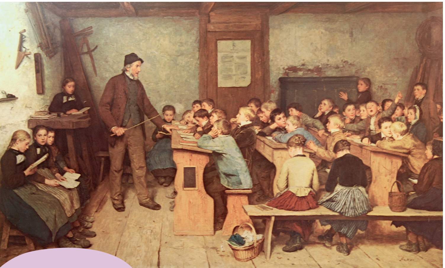
Ankers «Dorfschule» (1895/96)